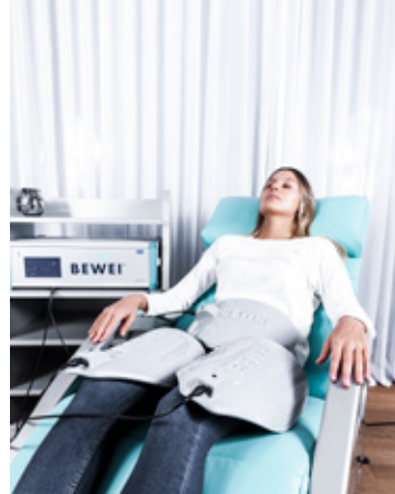
DAS BEWEI BODY CONCEPT IST FÜR FRAUEN UND MÄNNER. DIE BEHANDLUNG ERFOLGT BEKLEIDET.

MEHR VITALITÄT UND SCHÖNHEIT - GANZ ENTSPANNT IM LIEGEN!