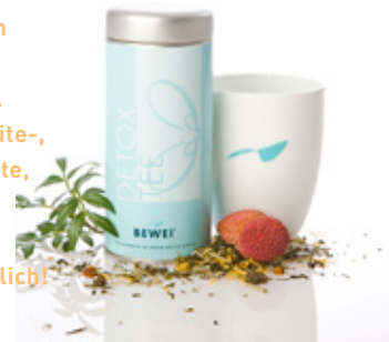
BEWEI DETOX TEE