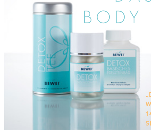
DAS BEWEI DETOX PROGRAMM

„Die BEWEI Methode mit dem Wellen-Trick “ schreibt seit 14 Jahren Erfolgsgeschichte . Skeptikerinnen, Diät-, Cellulite-, Schmerz- und Stress-Geplagte, sie alle waren sich nach den Behandlungen einig: dieses Konzept macht einfach glücklich!