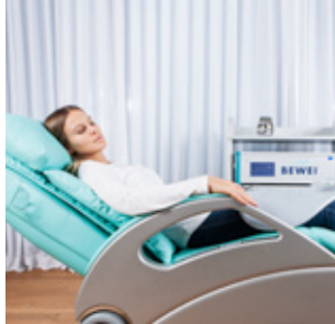
GENIEßEN SIE EINE WOHLTUENDE MASSAGE WÄHREND DER BEHANDLUNG

NEU in der BEWEI Family ist die WELTNEUHEIT BEWEI FACE . Ein speziell für das Gesicht entwickeltes BEWEI System, daß non-invasiv, altersbedingte Hautveränderungen, mit Soforteffekt verbessert. BEWEI FACE ist eine einzigartige Methode - ohne Injektion - die Gesichtshaut von innen SCHÖNER, JÜNGER und STRAFFER wirken zu lassen. Sie können die Behandlungen einzeln oder im Paket mit dem BEWEI BODY CONCEPT buchen. So oder so heißen wir sie: WILLKOMMEN IN IHREM NEUEN KÖRPER