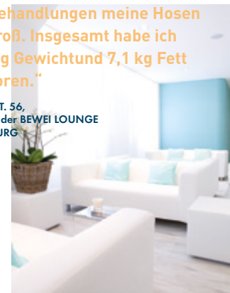
BEWEI LOUNGE HAMBURG