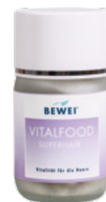
BEWEI SUPERHAIR, VITALPROGRAMM für kräftigeres Haar